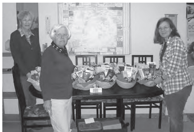
Erste Adresse für Fairen Handel in Hamm – der Weltladen in der Widumstraße