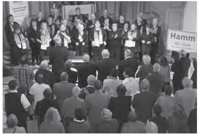
Gospeltrain begeisterte das Publikum beim Verleihungsfest „Hamm Stadt des Fairen Handels“ am 20. Oktober 2012 in der Martin-Lutherkirche.