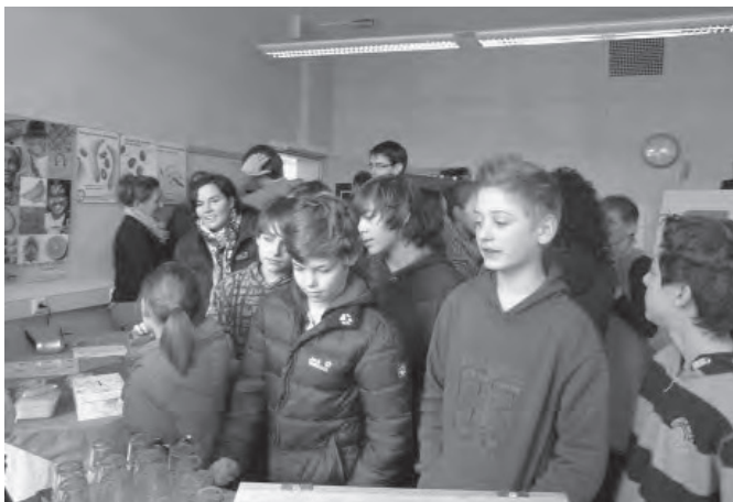
Waldorfschule: Der rote Faden zum Fairen Handel zieht sich durch die Freie Waldorfschule Hamm

Schnell war die Idee zum „Roten Faden“ geboren. Er lief in Form eines roten Seils durch die ganze Schule und alle paar Meter hatten wir unsere „Schocksätze“ daran geheftet, extra glänzend laminiert.