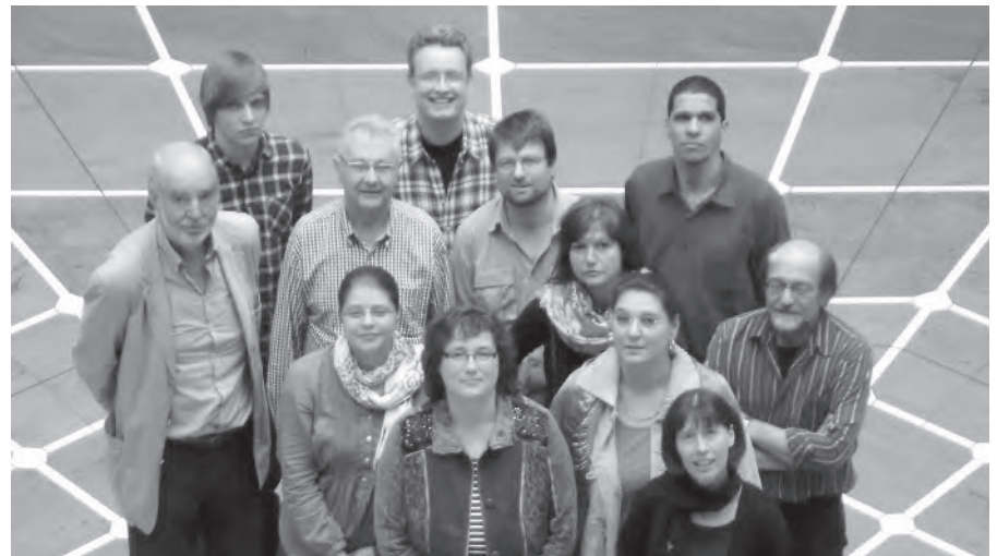
Netzwerk Faire Metropole Ruhr: Vertreter/-innen von Weltläden, Agenda-Büros, kirchlichen Einrichtungen und Eine-Welt-Zentren wie FUGe Hamm.

Aber es ist der erste Schritt zu einem langen Weg, den wir vor uns haben, die Struktur der wirtschaftlichen Zwänge zu erkennen und dann zu brechen.