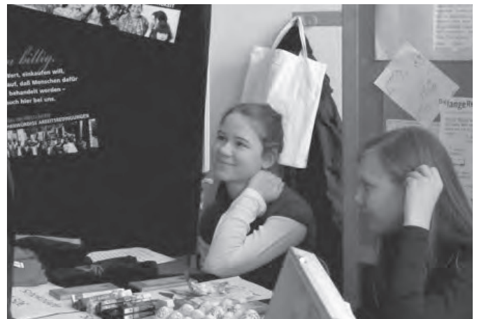
Waldorfschule: Die Schülerinnen und Schüler der 6. und 8. Klassen wurden zu Fairen Experten