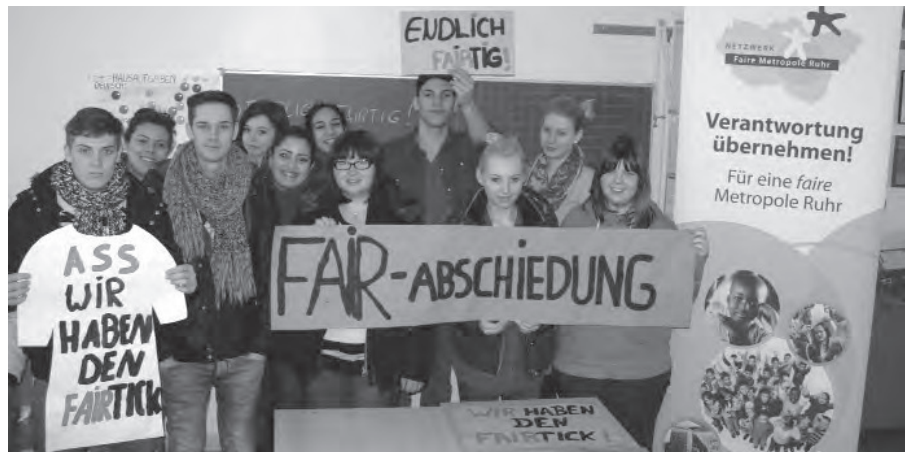
Albert-Schweitzer-Schule: Der Abschlussjahrgang der Albert-Schweitzer-Schule ist „Fairtig“!

Für unser ehrenamtliches Team im Weltladen in der Widumstraße bedeutet die Kampagne neben ganz viel Anerkennung auch ganz viel Mehrarbeit. Da immer mehr Menschen in Hamm bewusster einkaufen, hat sich der Kundenstamm in den letzten Monaten deutlich erhöht. Es werden viele interessante Gespräche geführt und der Umsatz hat sich gesteigert. In der Folge ist aber auch eine größere Vorratshaltung, verbunden mit häufigeren Einkaufsfahrten und eine größere Organisation aller Abläufe notwendig. Und auch inhaltlich hat